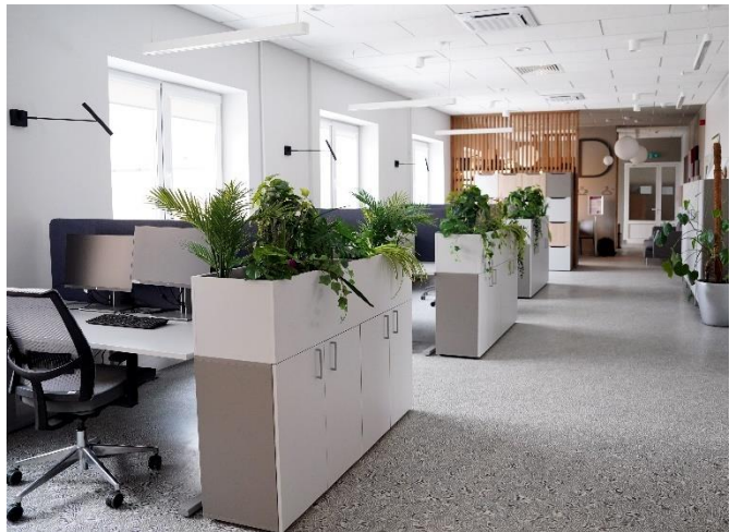
VZD kopstrādes telpas Rīgā

Tāpat VZD rūpēs par nodarbināto un klientu ērtībām uzsāka Klientu apkalpošanas centru telpu atjaunošanu ar modernu un ērtu iekārtojumu, ievērojot vienotu korporatīvo identitāti. 2022. gada vasarā pēc šādas koncepcijas darbu atjaunotās telpās uzsāka VZD Klientu apkalpošanas centra darbinieki Akadēmijas ielā 19, Jelgavā.