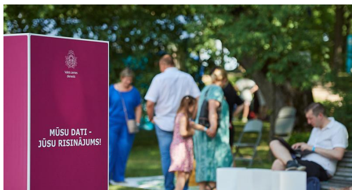
VZD stends sarunu festivālā "Lampa"

2022. gada sākumā VZD saņēma papildus nepieciešamo finansējumu, lai varētu atvērt datus no saviem reģistriem un datubāzēm – Kadastra informācijas sistēmas, Adrešu reģistra un Nekustamā īpašuma tirgus datubāzes. Dati tika publicēti Latvijas Atvērto datu portālā ( https://data.gov.lv/lv ) un Eiropas Kopienas ģeoportālā ( https://inspire-geoportal.ec.europa.eu/ ). Tika ieguldīts ļoti liels darbs sabiedrības informēšanā par VZD