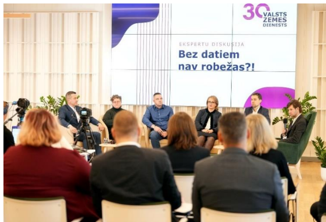
VZD organizētā diskusija "Bez datiem nav robežas"

Par godu VZD 30. gadadienai, organizējam diskusiju "Bez datiem nav robežas", kurā piedalījās Latvijā vadošie nozares eksperti – no Vides aizsardzības un reģionālās attīstības ministrijas, Mērniecības datu centra, Latvijas Biozinātņu un tehnoloģiju universitātes un Latvijas Kartogrāfu un ģeodēzistu asociācijas. Diskusijas dalībnieki dalījās ar savu pieredzi un novērojumiem, par VZD attīstību 30 gadu garumā, kuru laikā ir notikusi attīstība no plānu veidošanas ar zīmuli līdz pilna spektra atvērto datu publicēšanai, ļaujot iedzīvotājiem un uzņēmumiem sev nepieciešamo informāciju saņemt iespējami ātrāk un ērtāk.